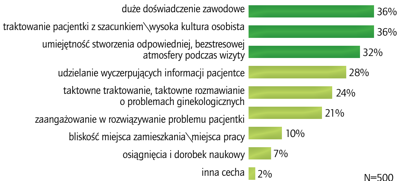
Wykres 1. Jakie czynniki wpływają na wybór lekarza ginekologa

kultura osobista i traktowanie pacjentki z szacunkiem.